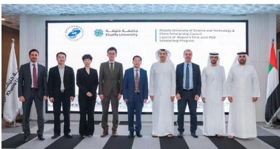
哈利法大学-CSC 联合博士奖学金启动仪式

哈利法大学是中国教育部涉外监管认可的阿联酋重点大学，是阿拉伯地区第一所与国家留学基金委（CSC）签订合作奖学金协议的大学，每年30个博士资助名额，提供4500美元/月生活津贴、原版教科书、医疗保险及来回机票，并免除学费及单身公寓费用。哈利法大学也单独提供多类奖学金，博士生活津贴最高达80000人民币/月，免除学费并提供单身公寓、医疗保险、年度往返机票，努力提升学生生活质量，创造良好的学习与科研环境。哈利法大学优秀本硕及博士毕业生还能获得阿联酋金卡（十年工作签证）。