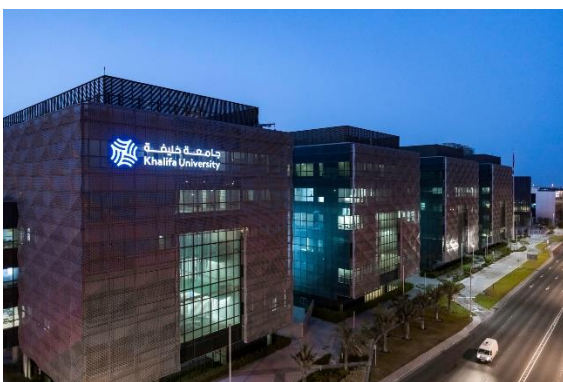
哈利法大学主校区科教大楼外景

哈利法大学是阿布扎比政府全力打造的高等学府，已成为阿联酋最优秀的研究型大学。哈利法大学工学院涵盖了机械材料与核能、电气电子与计算机、生物医学、化工与石油、土木与环境、航空航天、管理科学等几乎所有工程院系，并设有理学院、医学与健康科学院，拥有马斯达尔研究院、石油研究院、机器人与智能系统研究院等一大批研究机构。哈利法大学采用美国学制，现有 400 多名教授，来自世界 40 多个国家，均毕业或曾执教于世界顶级学府，师资力量雄厚多元，拥有世界一流实验室，研究经费充裕。哈利法大学在 2023 年 QS 世界大学排名中位列 181、在整个阿拉伯地区（22 个国家）也名列前茅，正成为中东非洲首屈一指的世界一流大学。