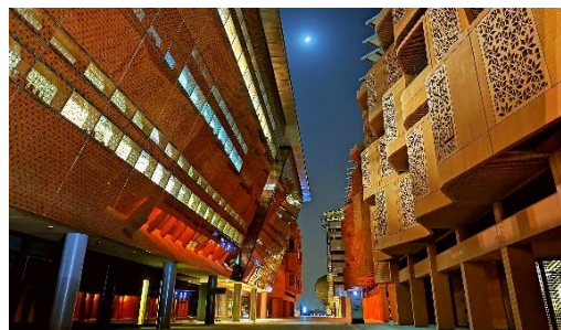
哈利法大学研究生宿舍